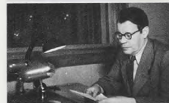
У микрофона — известный советский поэт Михаил Исаковский читает свои новые стихи.