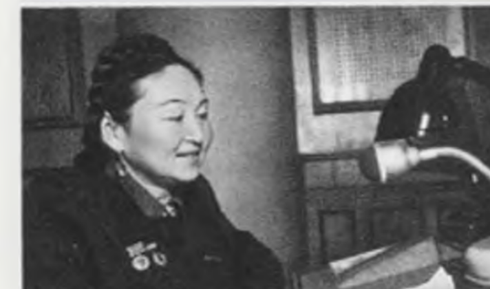
С рассказом о Втором Конгрессе сторонников мира выступает лауреат Сталинской премии народная артистка СССР Куляш Байсентова (Казахстан).